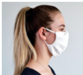
Élastiques Derrière les oreilles